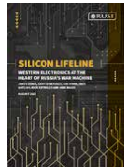
Räni päästerõngas: lääne- riikide elektroonika Vene sõjamasinate südames Kuninglik Kaitseuuringute Instituut (RUSI), 2022

Esindusdemokraatia ja erakondade roll Euroopa Liidu juhtimises on aina põletavam küsimus, sest Euroopa integratsioon on liikumas politiseeritud valdkondadesse. Mõned jõud leiavad, et arutama peaks ka aluslepingute muutmist ning esindusdemokraatia tugevdamist, teised ei taha sellest kuulda.