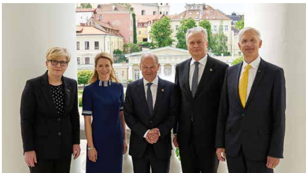
Leedu peaminister Ingrida Šimonytė, Eesti peaminister Kaja Kallas, Saksamaa liidukantsler Olaf Scholz, Leedu president Gitanas Nausėda ja Läti peaminister Krišjānis Kariņš 7. juunil Vilniuses.

28.–30.06 NATO Madridi tippkohtumine. Eesti delegatsiooni kuulusid peaminister Kaja Kallas, kaitseminister Kalle Laanet, ettevõtlus- ja