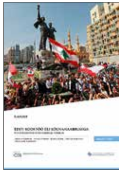
Eesti koostöö ELi lõunanaabrusega: strateegilised eesmärgid ja fookus RKK Eesti Välispoliitika Instituut, 2022

RKK seeria võtab luubi alla nii sõja alguse ja sellele eelnenud ettevalmistused, sõjalogistika probleemid kui ka sõjapidamise erinevates sfäärides – merel, õhus ja küberruumis. Muu hulgas analüüsitakse Venemaa propaganda ja desinformatsiooni ulatust ja sisu, et mõista selle rolli Ukraina invasiooni planeerimisel.