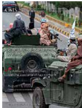
Abiandmiseks õigete tingimuste loomine Afganistanis ja teistes riikides Rahvusvaheline Strateegiliste Uuringute Instituut, 2022

Lähis-Ida ja Põhja-Aafrika riikide käekäik on Eestile tähtis, sest nende demokraatliku arengu toetamine ja stabiilsuse tagamine aitab kaasa Eesti laiemate välispoliitiliste eesmärkide saavutamisele. ELi lõunanaabruse riikides tegutsemine näitab, et Eesti huvitub ka ELi kui terviku tulevikust.