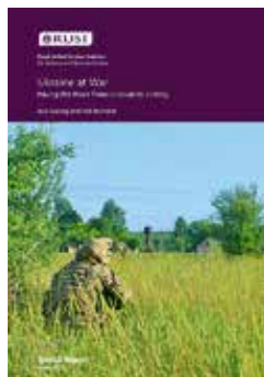
Ukraina sõjas: tee rajamine ellujäämisest võiduni Kuninglik Kaitseuuringute Instituut (RUSI), 2022

Kas tänaste otsuste tegemisel peaks arvestama ka järeltulevate põlvdedega, potentsiaalselt kümnete triljonite inimestega, kes võivad veel sündida? MacAskill ei kutsu üles sellistele rahvale vastu võetamatutele lahendustele nagu majanduskasvu aeglustamine ja tehnoloogiline seisak, aga julgustab mõtlema pikaajalisemalt kui järgmine valimistsükkel.