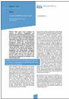
Venemaa sõda Ukrainas Rahvusvaheline Kaitse- uuringute Keskus, 2022

RKK seeria võtab luubi alla nii sõja alguse ja sellele eelnenud ettevalmistused, sõjalogistika probleemid kui ka sõjapidamise erinevates sfäärides – merel, õhus ja küberruumis. Muu hulgas analüüsitakse Venemaa propaganda ja desinformatsiooni ulatust ja sisu, et mõista selle rolli Ukraina invasiooni planeerimisel.