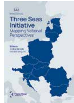
Kolme mere algatus: analüüsid riiklike vaatenurki Läti Rahvusvaheliste Suhete Instituut, 2022

Talibani võimule naasmisest Afganistanis on möödunud aasta. Režiim on mõnevõrra stabiliseerunud, aga pole sugugi selge, kuidas õnnestub Talibanil sisse viia tõhus valitsemine. Analüüsis otsitakse vastust, kuidas toetada kannatavaid elanikke nii, et Taliban ei kasutaks seda oma võimu kinnistamiseks.