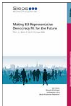
ELi esindusdemokraatia sobitamine tulevikuga Rootsi Euroopa Poliitika- uuringute Instituut, 2022

Ukraina ellujäämise taganud liitlaste toetus ei ole piisav, et kindlustada Ukraina võitu lahinguväljal võitluses Venemaa agressiooniga. Nüüd on vaja anda spetsiifilisi relvasüsteeme, et turgutada Ukraina armeed kindlaid nõrkusi ning tõrjuda Vene poole eelseid suurtükiväe ja tiibraketide kasutamisel.