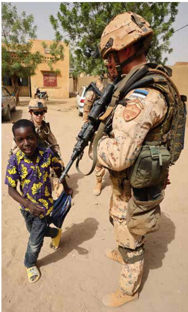
Malis operatsioonis Barkhane osalenud Eesti kaitsevälelased viimasel patrullil.

03.06 Lõppes suurõppus Siil. Õppustel harjutas Eesti kaitsemist ligi 15 300 reservväelast, tegevväelast, ajateenijat, kaitseliitlast ja liitlasriikide sõdurit.